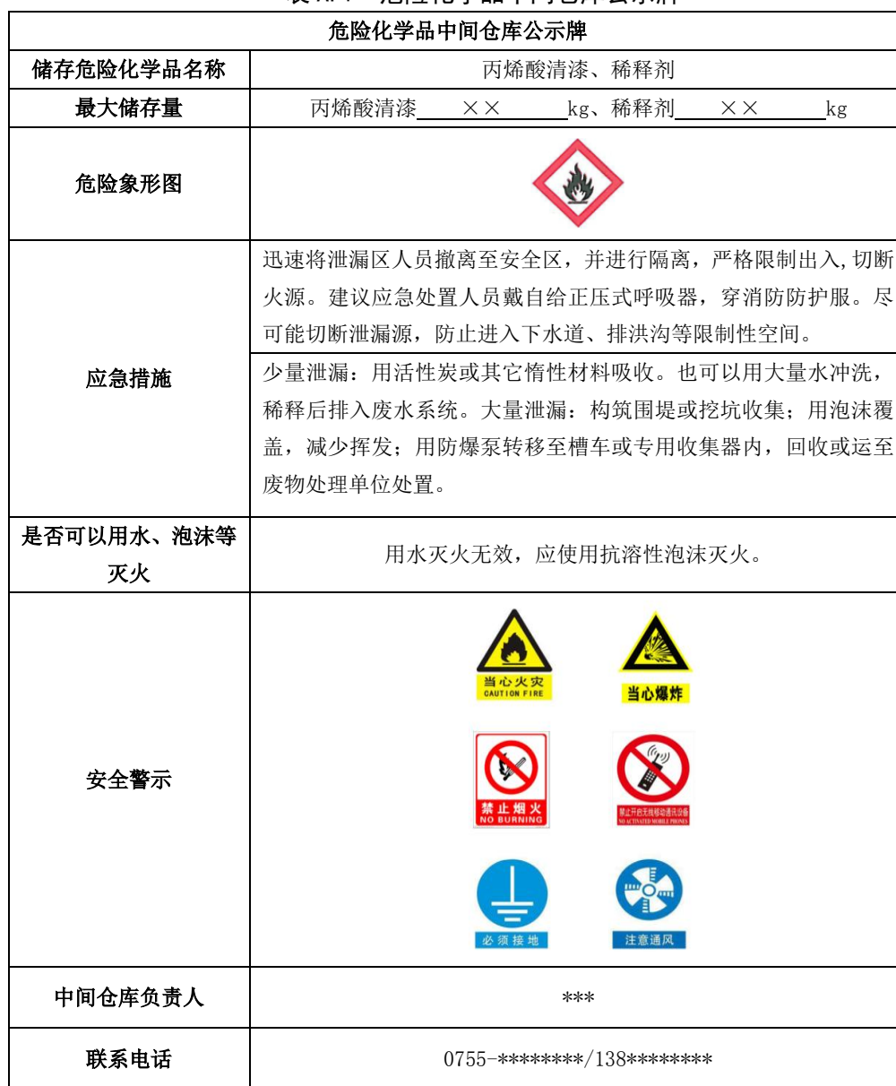
表 A.1 危险化学品中间仓库公示牌